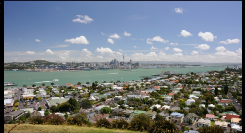
16.12. 14:33 36° 49' 36" S 174° 47' 54" E