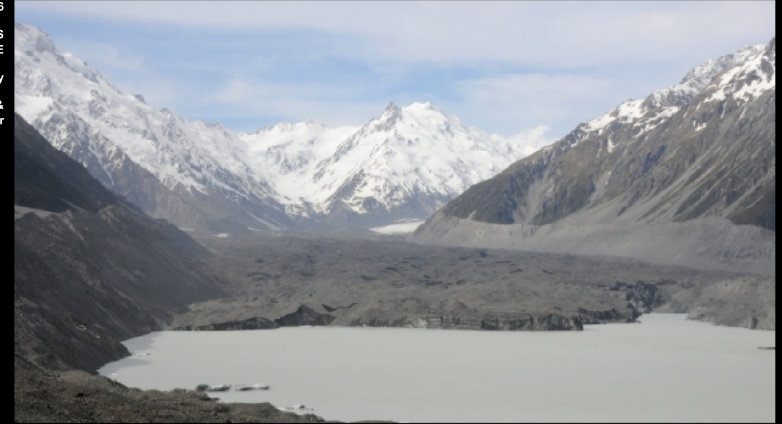
21.11. 17:16 43° 41' 45" S 170° 10' 06" E Tasman Valley Tasman Lake & Tasman Glacier