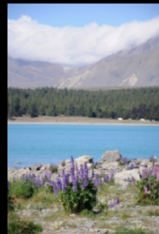
21.11. 11:10 44° 05' 20" S 170° 08' 08" E Lake Pukaki Aoraki Mount Cook