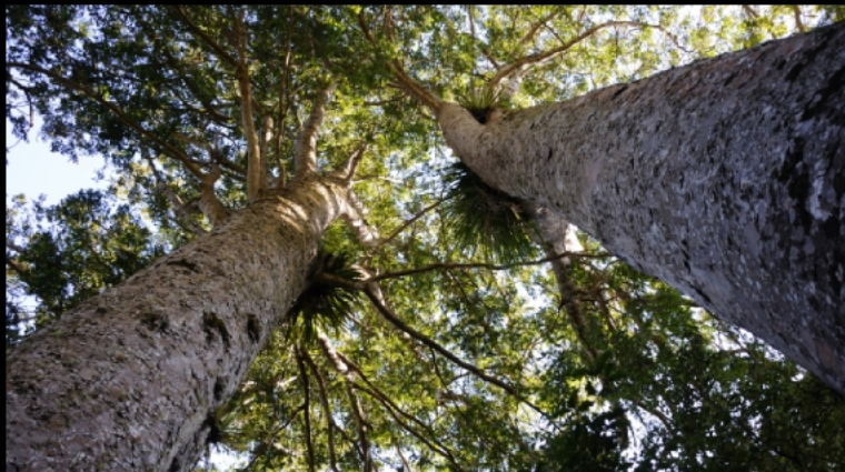
13.12. 09:10 36° 50' 19" S 175° 33' 07" E The 309 Road Waiau Kauri Grove