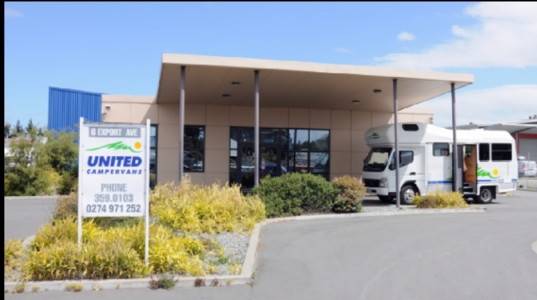
18.11. 15:00 43° 28' 19" S 172° 33' 33" E United Campervans 6 Export Avenue Airport Business Park Harewood Christchurch 8051

Transparenter Bereich kann beschnitten werden