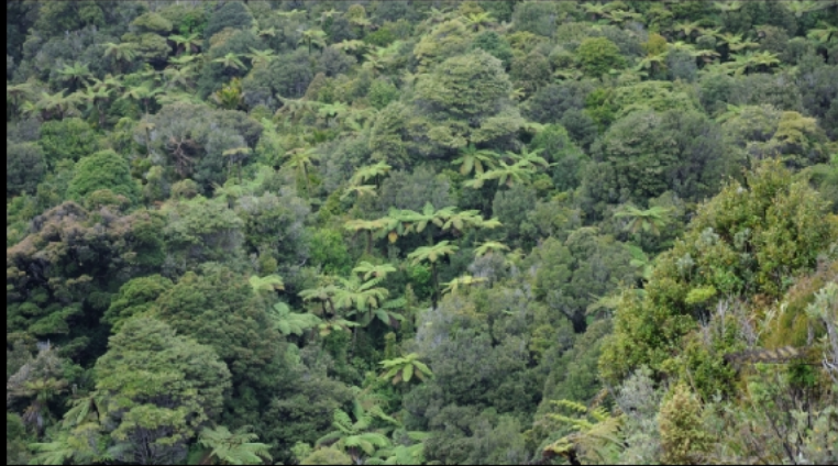
02.12. 15:23 42° 04' 30" S 171° 21' 18" E Irimahuhero Viewpoint

Transparenter Bereich kann beschnitten werden