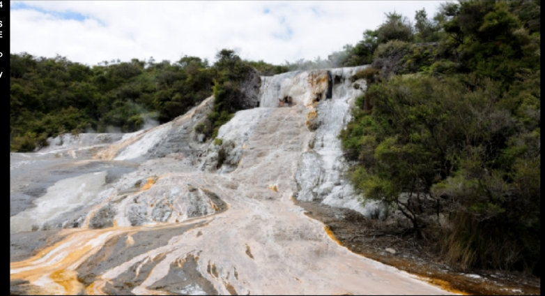
11.12. 11:34 38° 28' 24" S 176° 08' 48" E Orakei Korako Hidden Valley