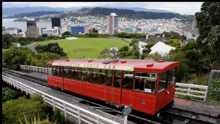
09.12. 12:50 41° 17' 06" S 174° 46' 04" E Wellington Cable Car