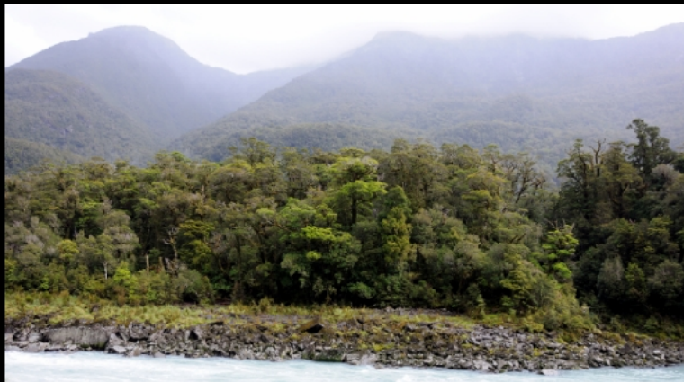
02.12. 14:08 42° 06' 52" S 171° 19' 37" E Punakaiki Pancake Rocks