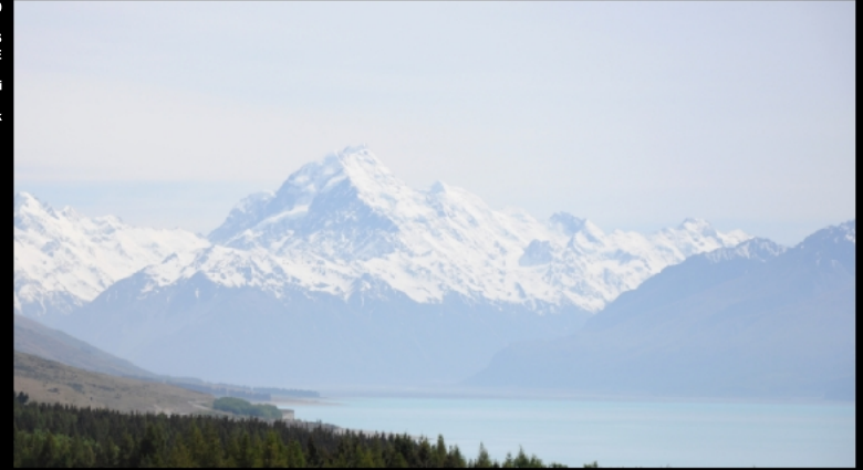
21.11. 11:47 43° 44' 57" S 170° 06' 59" E Mount Cook Village