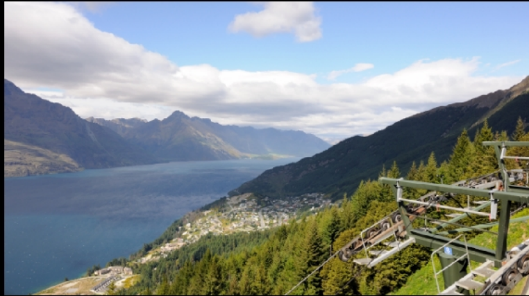
29.11. 10:01 45° 01' 35" S 168° 38' 56" E Queenstown Gondola 53 Brecon Street Boydton Queenstown 9300

Transparenter Bereich kann beschnitten werden