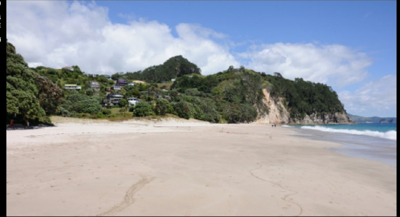
13.12. 11:00 36° 50' 13" S 175° 48' 16" E Hahei