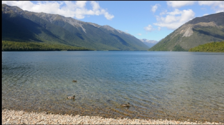
05.12. 10:35 41° 48' 23" S 172° 50' 39" E St. Arnaud Lake Rotoiti

Transparenter Bereich kann beschnitten werden