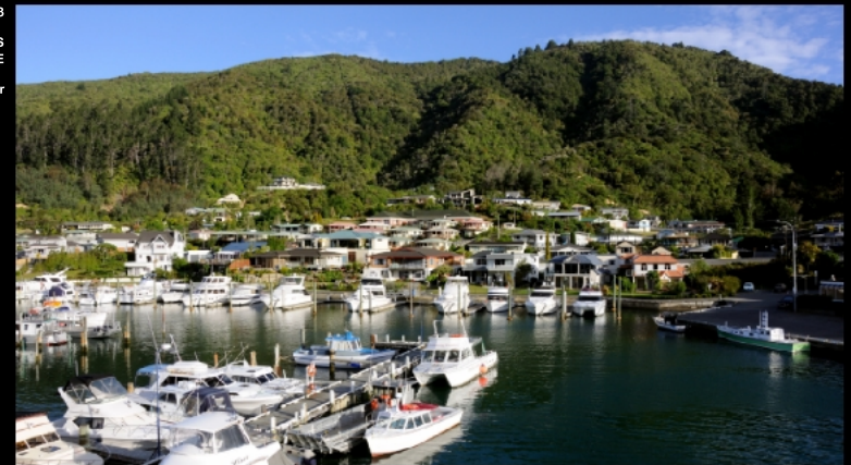
07.12. 19:13 41° 17' 20" S 174° 00' 36" E Picton Harbour

Transparenter Bereich kann beschnitten werden