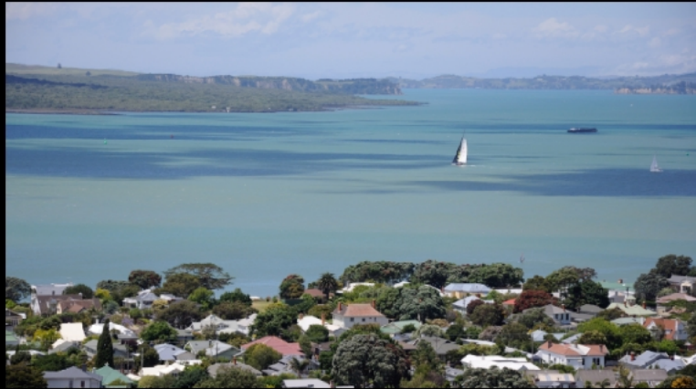
16.12. 14:18 36° 49' 35" S 174° 47' 58" E Auckland Devonport Mount Victoria

Transparenter Bereich kann beschnitten werden