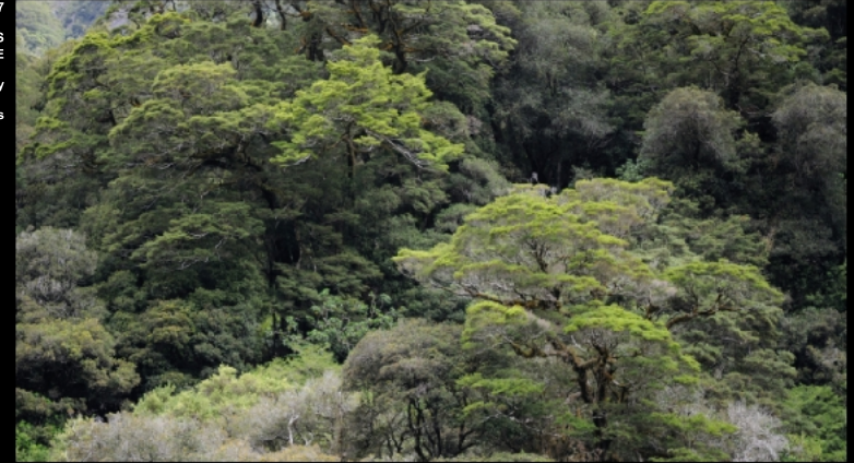
30.11. 17:27 44° 02' 14" S 169° 22' 03" E Haast Pass Highway Thunder Creek Falls