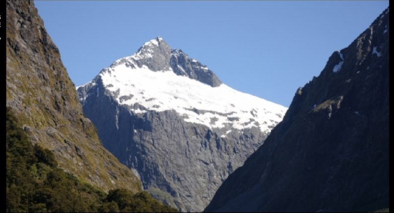
27.11. 10:31 44° 48' 03" S 168° 01' 17" E Milford Sound Highway