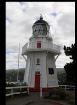
20.11. 09:00 43° 48' 45" S 172° 57' 23" E Akaroa Lighthouse

Transparenter Bereich kann beschnitten werden