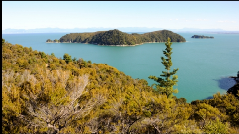
05.12. 17:43 40° 57' 48" S 173° 03' 09" E Abel Tasman Park Adele Island

Transparenter Bereich kann beschnitten werden