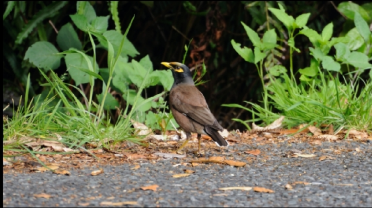
14.12. 18:33 35° 36' 01" S 173° 31' 39" E Waipoua Forest Myna / Hirtenmaina ( Acridotheres tristis )

Transparenter Bereich kann beschnitten werden