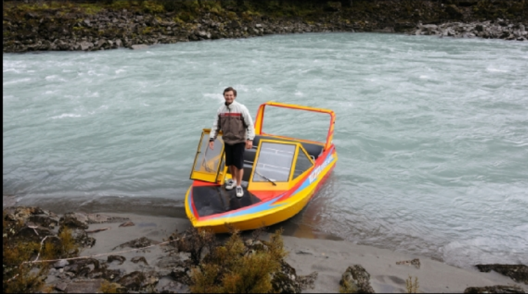
01.12. 11:00 44° 03' 36" S 168° 52' 09" E Waiatoto River

Transparenter Bereich kann beschnitten werden