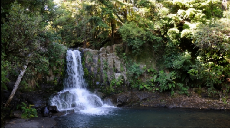
13.12. 08:49 36° 49' 55" S 175° 32' 50" E The 309 Road Waiau Falls

Transparenter Bereich kann beschnitten werden