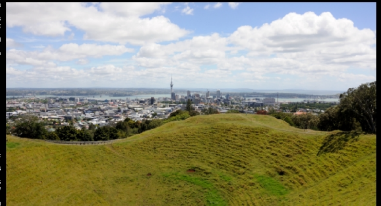
nächste Doppelseite: 19.12. 04:24 06° 43' 58" S 149° 16' 57" W Rückflug

Transparenter Bereich kann beschnitten werden