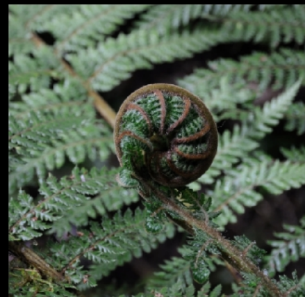
rechte Seite: 10.12. 09:30 39° 23' 51" S 175° 25' 02" E Ohakune Mangawhero Forest Walk