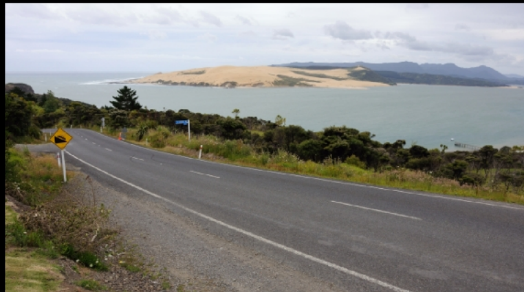
14.12. 18:25 35° 32' 26" S 173° 23' 12" E Omapere Opononi-Sanddünen