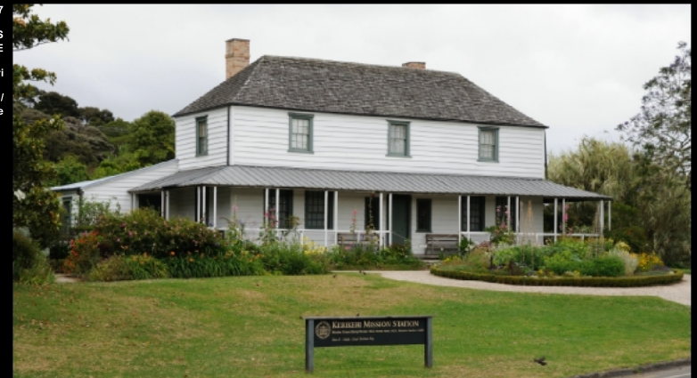
15.12. 08:37 35° 13' 03" S 173° 57' 45" E Kerikeri Mission House / Kemp House

Transparenter Bereich kann beschnitten werden