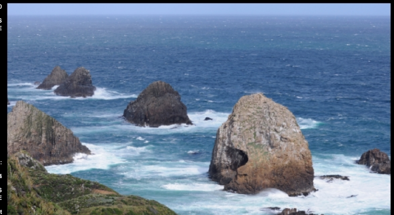
nächste Doppelseite: 26.11. 16:24 45° 48' 36" S 167° 40' 56" E Blackmount

Transparenter Bereich kann beschnitten werden