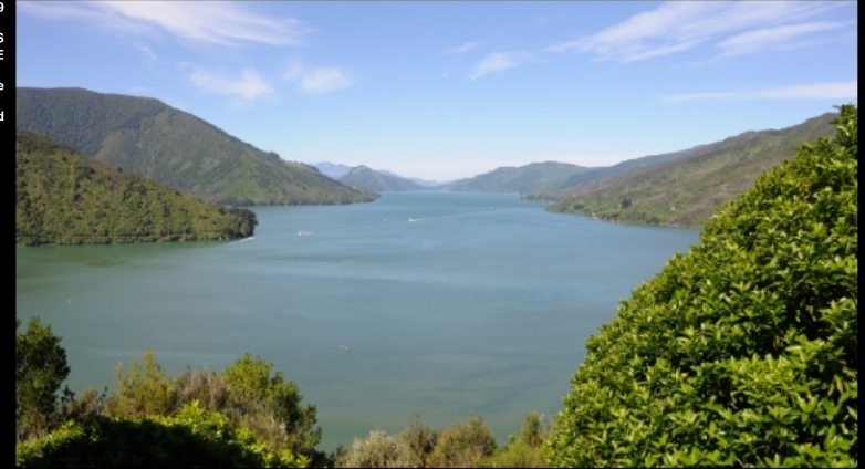
07.12. 16:29 41° 16' 02" S 173° 46' 59" E Queen Charlotte Drive Mahau Sound