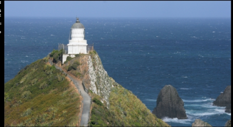
25.11. 16:32 46° 26' 47" S 169° 48' 48" E Kalmataitai Nugget Point Lighthouse