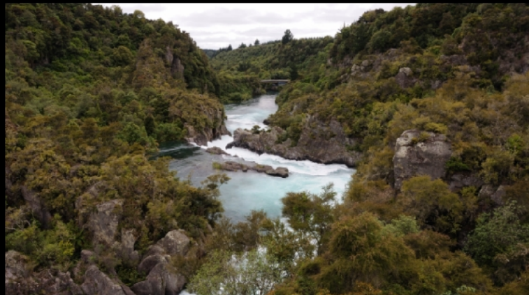
11.12. 10:13 38° 37' 03" S 176° 08' 20" E Aratiatia Rapids