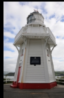
20.11. 10:43 43° 43' 34" S 172° 55' 59" E Banks Peninsula