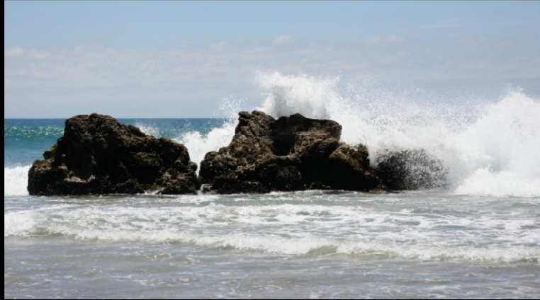
13.12. 12:17 36° 53' 09" S 175° 49' 22" E Hot Water Beach

Transparenter Bereich kann beschnitten werden