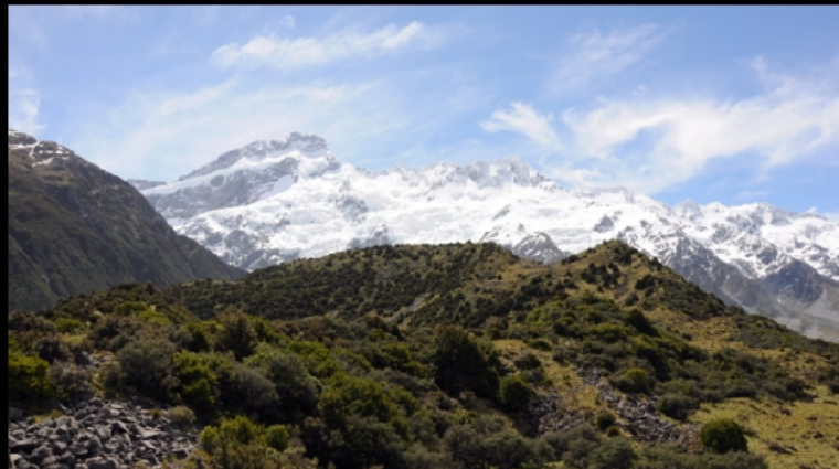
21.11. 15:32 43° 43' 04" S 170° 05' 48" E Hooker Valley Mount Sefton