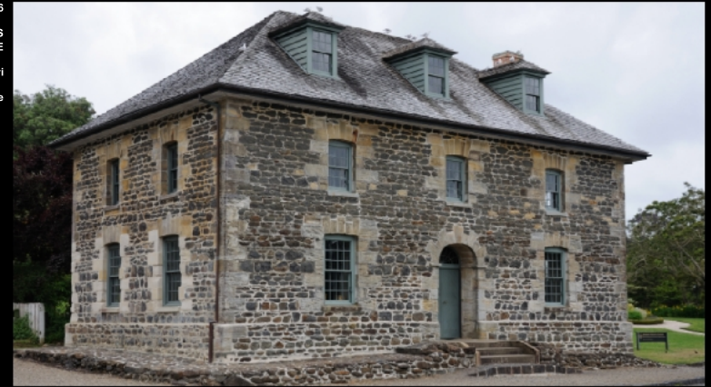
15.12. 08:36 35° 13' 04" S 173° 57' 46" E Kerikeri Stone Store