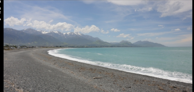
04.12. 15:05 42° 25' 00" S 173° 41' 46" E Kaikoura Scarborough Street