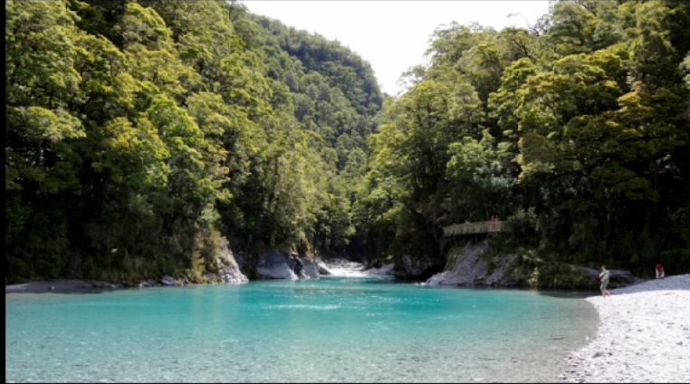
30.11. 15:31 44° 09' 41" S 169° 16' 17" E Haast Pass Makarora Road Blue Pools

Transparenter Bereich kann beschnitten werden