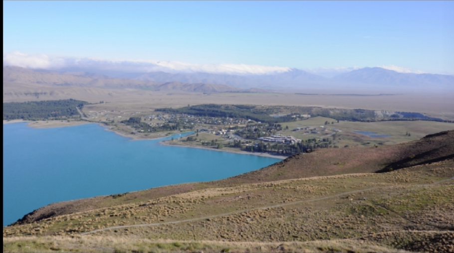
20.11. 18:44 43° 59' 07" S, 170° 27' 53" E Lake Tekapo Blick vom Mount John

Transparenter Bereich kann beschnitten werden