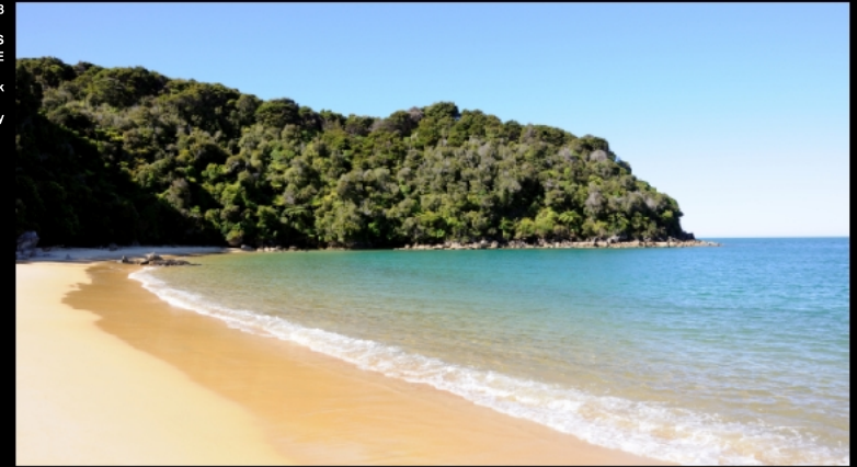
05.12. 16:58 40° 57' 12" S 173° 03' 51" E Abel Tasman Park Te Pukatea Bay