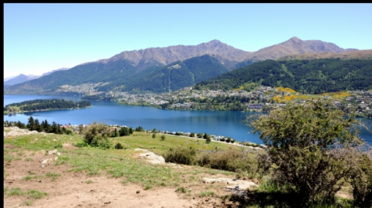
28.11. 12:58 45° 02' 25" S 168° 42' 28" E Kelvin Peninsula Deer Park Heights