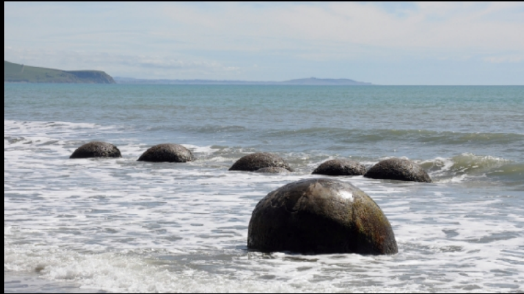
23.11. 11:02 45° 20' 51" S 170° 49' 36" E Moeraki Boulders

Transparenter Bereich kann beschnitten werden