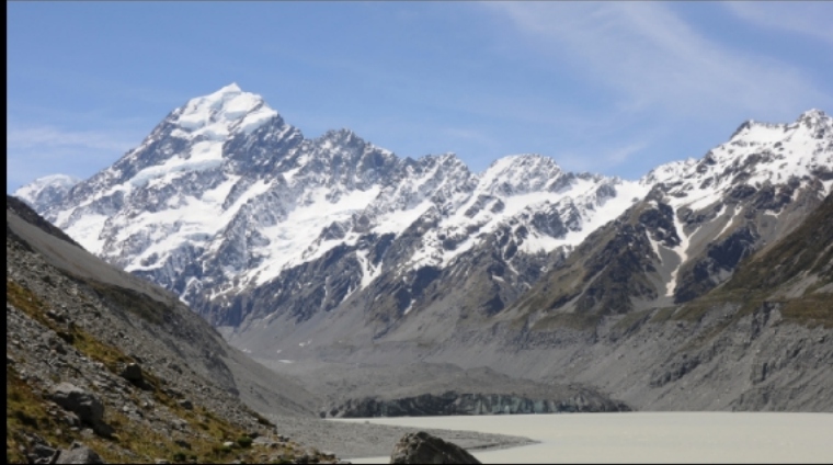
21.11. 14:07 43° 41' 17" S 170° 05' 59" E Hooker Valley Hooker Lake, Hooker Glacier & Aoraki Mount Cook

Transparenter Bereich kann beschnitten werden