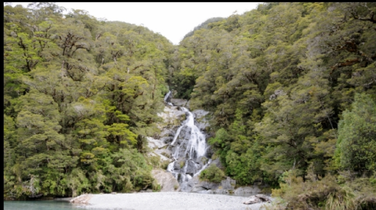
30.11. 16:44 44° 04' 38" S 169° 23' 10" E Haast Pass Highway Fantail Falls