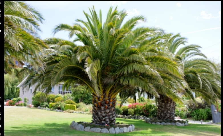
linke Seite: 04.12. 12:00 42° 30' 48" S 173° 43' 50" E Kaikoura Airport Pottwal

Transparenter Bereich kann beschnitten werden