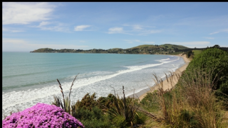
23.11. 12:05 45° 20' 52" S 170° 49' 36" E Moeraki