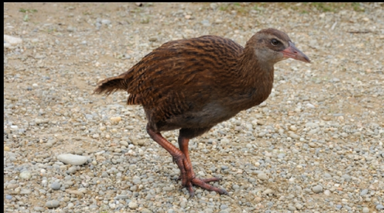
rechte Seite: 02.12. 16:45 41° 45' 49" S 171° 27' 24" E Cape Foulwind Tauranga Bay