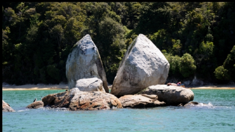
05.12. 15:28 41° 01' 05" S 173° 01' 14" E Abel Tasman Park Split Apple Rock