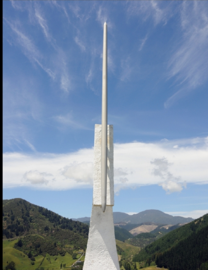
07.12. 14:41 41° 16' 19" S 173° 17' 58" E Nelson Centre of New Zealand

Transparenter Bereich kann beschnitten werden