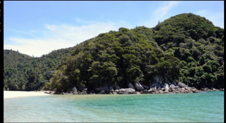
06.12. 12:59 40° 56' 08" S 173° 03' 31" E Abel Tasman Park Frenchman's Bay