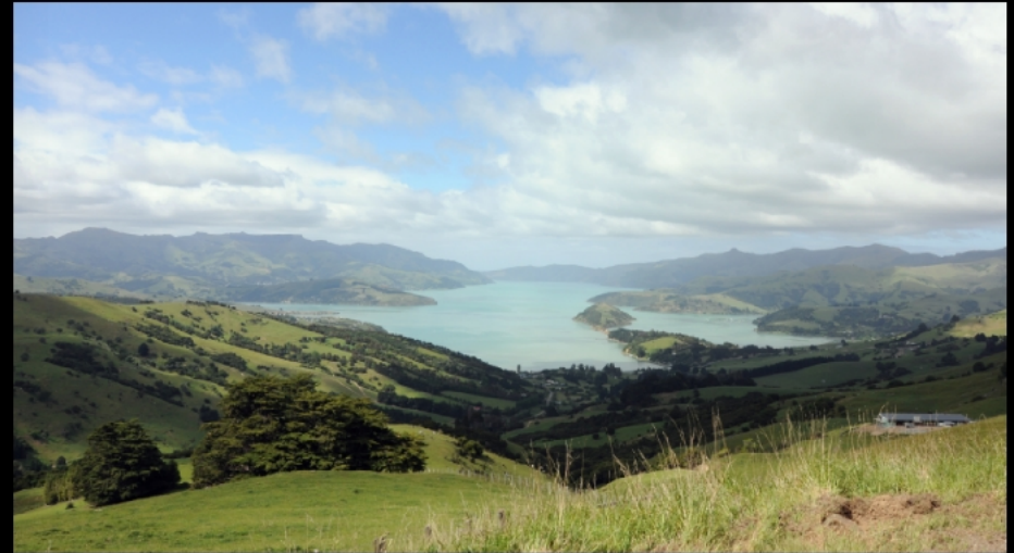
19.11. 15:00 43° 35' 21" S 172° 43' 00" E Christchurch Gondola 10 Bridle Path Road Heathcote Christchurch 8022