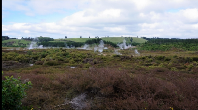
11.12. 09:00 38° 38' 39" S 176° 04' 16" E Taupo Craters of the Moon

Transparenter Bereich kann beschnitten werden