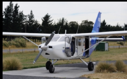
04.12. 14:24 42° 24' 02" S 173° 40' 57" E Kaikoura