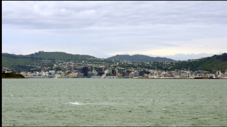
08.12. 12:31 41° 16' 31" S 174° 51' 03" E Interislander Ferry Wellington

Transparenter Bereich kann beschnitten werden