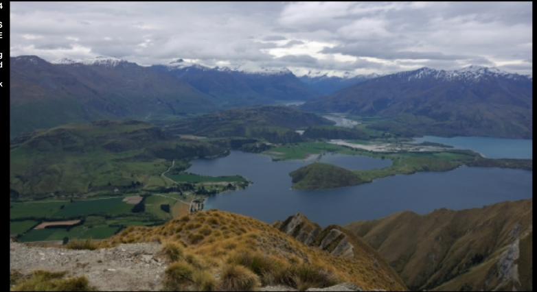
29.11. 16:34 44° 41' 21" S 169° 02' 59" E Wanaka Mount Aspiring Road Roy's Peak