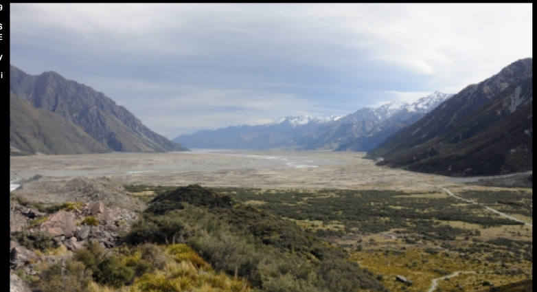
21.11. 17:19 43° 41' 45" S 170° 10' 06" E Tasman Valley Blick zum Lake Pukaki

Transparenter Bereich kann beschnitten werden