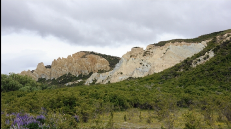
22.11. 10:55 44° 29' 18" S 169° 52' 40" E Omarama Clay Cliffs

Transparenter Bereich kann beschnitten werden