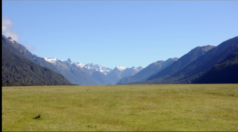
27.11. 09:19 45° 03' 44" S 167° 59' 38" E Te Anau Milford Highway

Transparenter Bereich kann beschnitten werden