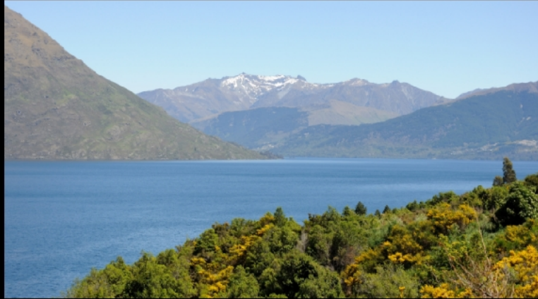
28.11. 12:22 45° 06' 13" S 168° 45' 23" E Lake Wakatipu Drift Bay

Transparenter Bereich kann beschnitten werden