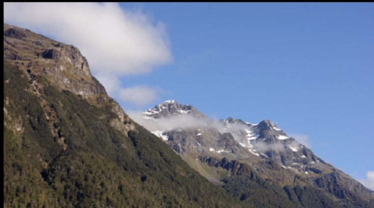
vorherige Doppelseite: 26.11. 17:16 45° 33' 52" S 167° 36' 41" E Manapouri Surprise Bay