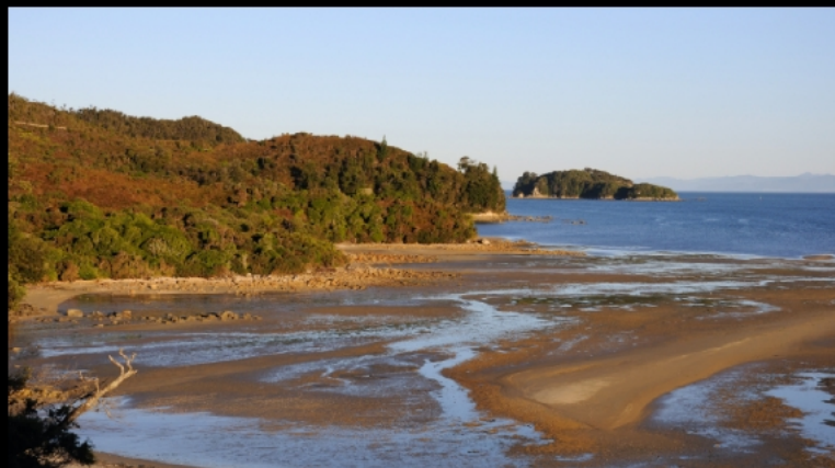
05.12. 20:10 40° 59' 26" S 173° 00' 54" E Abel Tasman Park Coquille Bay Fisherman Island