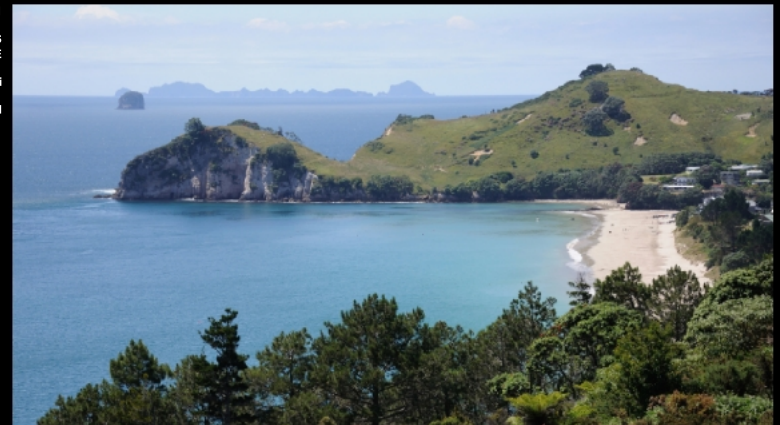
13.12. 11:21 36° 50' 00" S 175° 47' 57" E Hahei Grange Road

Transparenter Bereich kann beschnitten werden